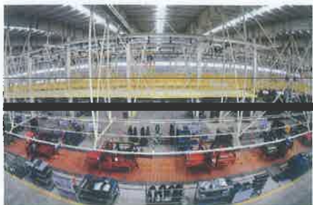
北汽集团华北(黄骅)汽车产业基地汽车生产线